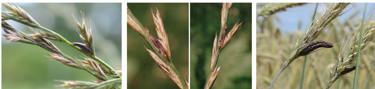
Abbildung 1: Mutterkorn ( Claviceps purpurea ) an Bastardraigras (links) und Roggen (rechts). Befallene Ähren scheiden Honigtau aus (Mitte). Dieser enthält Konidien, die Sekundärinfektionen auslösen können.

Hauptsächlich betroffene Getreidearten sind Roggen und Triticale, deren Blüten als Fremdbefruchter über einen längeren Zeitraum geöffnet bleiben. In anhaltend feuchten und kühlen Frühjahren werden aber auch Weizen und Gerste befallen und es kann zu einer Kontamination des Erntegutes mit Mutterkorn und den darin enthaltenen toxischen Verbindungen (Ergotalkaloide) kommen. Bisher sind über 50 verschiedene Ergotalkaloide bekannt. Die wichtigsten Ergotalkaloide der Art Claviceps purpurea sind Ergometrin, Ergotamin, Ergosin, Ergocristin, Ergocryptin und Ergocornin sowie deren Epimere.