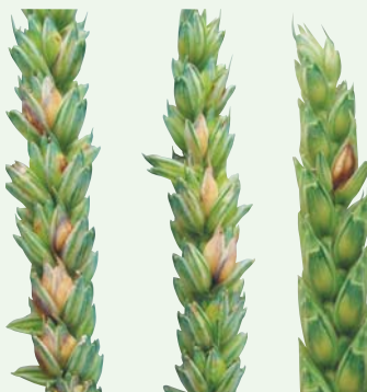
Symptome von Fusarium poae auf Weizenähren.