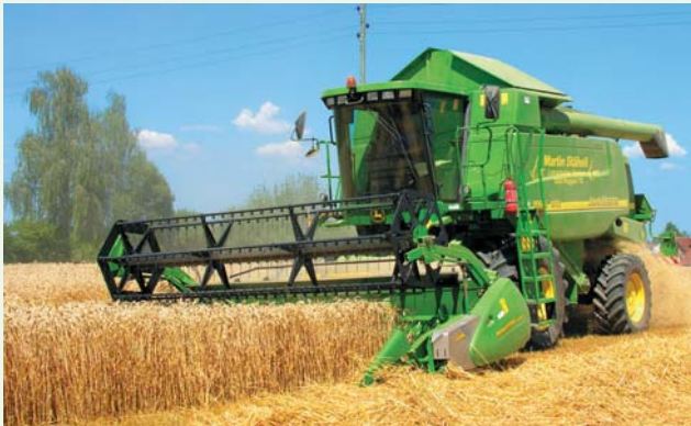
Der Mähdrescher ist so einzustellen, dass viele Strohanteile, Spelzen und Schmachtkörner ausgeschieden werden.

Die Produktion von gesunden Nahrungs- und Futtermitteln muss im Zentrum aller anbautechnischen Massnahmen stehen (siehe Seite 2 und 3).