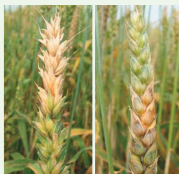
Symptome von Fusarium graminearum auf Weizen.

Fusarienkomplex und Infektionsverlauf Ährenfusariosen werden in der Schweiz durch verschiedene Fusarien-Arten verursacht. Die weitaus häufigste Art ist Fusarium graminearum (FG). Infektionen durch FG erfolgen meistens von befallenen Pflanzenresten der Vorkultur (z.B. Mais, Getreide) auf der Bodenoberfläche (Grafik). Speziell gefährlich sind ab Beginn bis Ende Getreideblüte freigesetzte Sporen, die mit Wind oder Regenspritzern auf die Ähren verfrachtet werden. Bei Nässe, z.B. in Tautropfen, keimen die Sporen und dringen in die Pflanze ein.