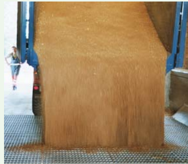
Vor der Entladung in die Gasse ist die Lieferung visuell zu kontrollieren.